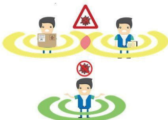
Figura 3: Distanziamento sociale

È necessario igienizzarsi le mani frequentemente nei dispenser o lavarsi le mani con il sapone a disposizione.